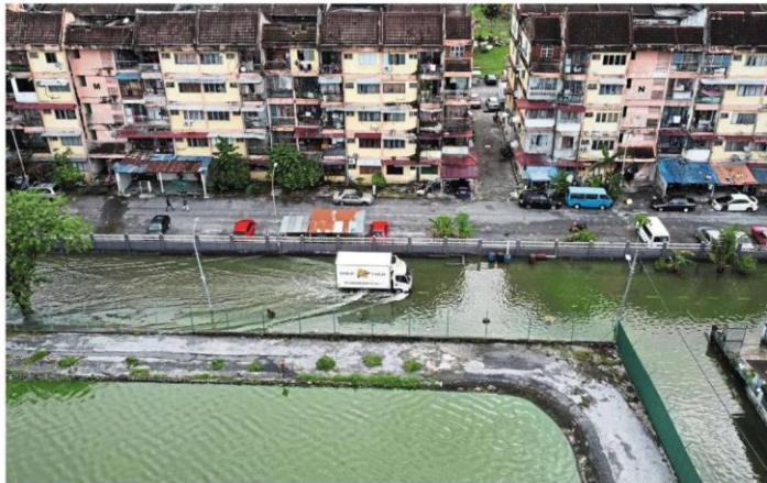
Jalan Tokoh 25/28 outside Valencia Apartment in Taman Sri Muda, Shah Alam, is almost impassable to vehicular traffic when there is heavy rain.

By EDWARD RAJENDRA edward@thestar.com.my