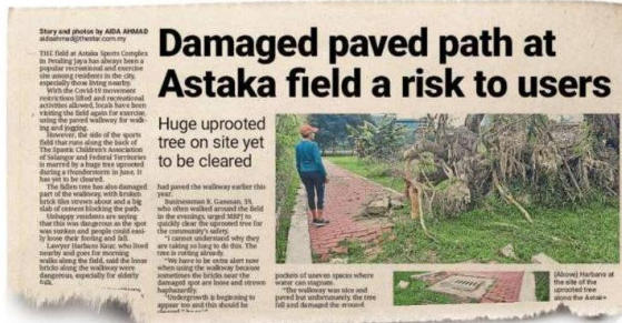
StarMetro's report on Oct 19.

PETALING Jaya City Council (MBPJ) has issued a directive to its Landscape Department to get the damaged walkway at the Astaka Sports Complex field repaired.