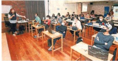
“雪兰莪新创企业加速器计划”已成功培养 120 位创新思维和数字化经营的企业。