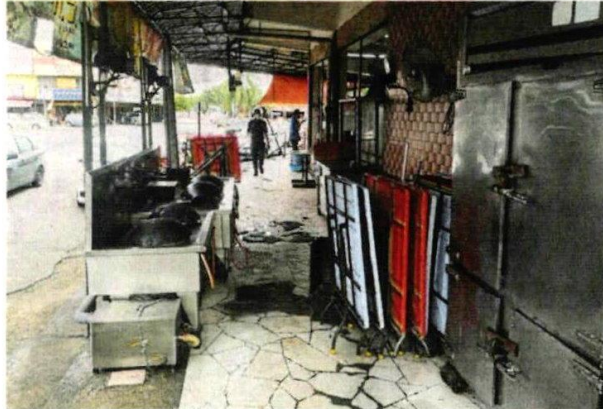
■商家受促不要再霸占公共空间，否则将被罚款。