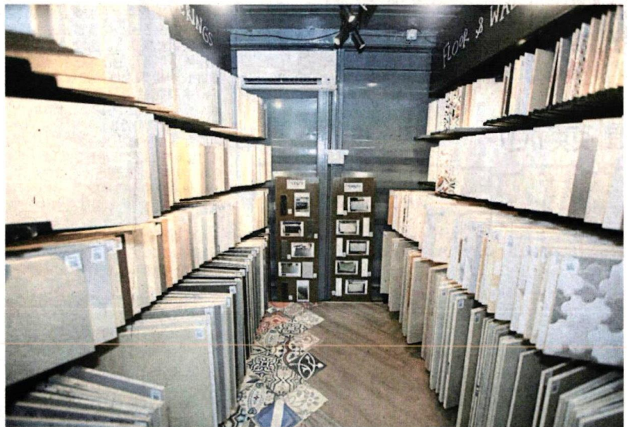
■Yellow Box在一个20英尺的货柜箱内,展示超过800多种家居室内装饰和装修产品。

Yellow Box在一个20英尺的货柜箱内,展示超过800多种家居室内装饰和装修产品,包括地砖、墙砖、通风砖和家居饰品等,消费者只需扫描商品二维码,即可询问产品细节并下单,订购货品由物流公司