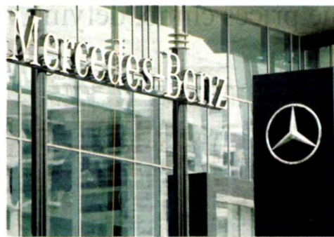
Azmin says Mercedes-Benz's decision is an embodiment of the company's confidence in Malaysia's conducive ecosystem and our strength to support their long-term growth

Mercedes-Benz joins the increasing trend of establishment of global and regional distribution hubs in Malaysia by companies in industries such as automotive, life sciences and medical devices, elec-