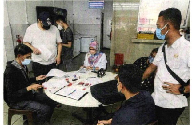
■市议会取缔7间餐馆，共发出10张罚单给违例业者。